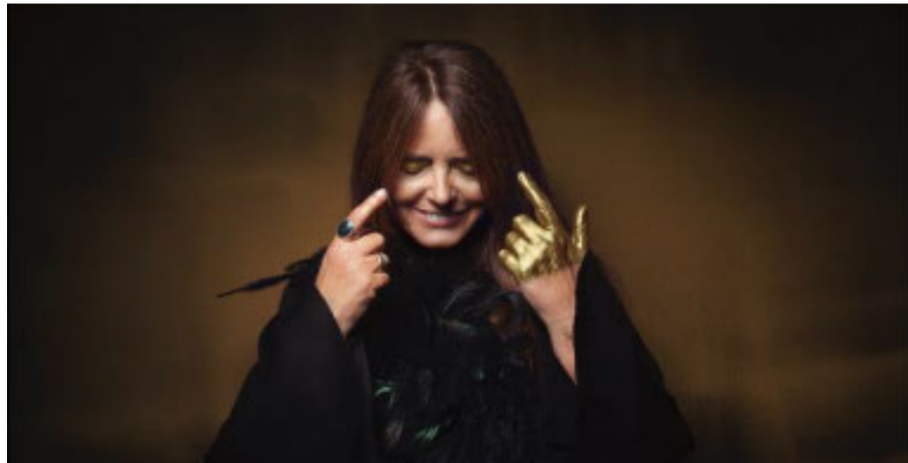
Nada e Ligabue tra i grandi protagonisti a Chiavari

A inaugurare il ciclo di incontri sarà, domenica 4 luglio alle 21.30, il cantautore Luciano Ligabue, protagonista di una chiacchierata ad ampio raggio moderata dal giornalista Massimo Poggini, con la partecipazione dell'autore Massimo Cotto e del regista Duccio Forzano. Al rocker di Correggio verrà consegnato il premio «Ambasciatore della Parola» 2021, una delle novità dell'ottava edizione del Festival della Parola, assegnato a personalità di spessore che si sono distinte in ambito culturale, artistico o scientifico. Cantautore, scrittore, regista, con 22 album, 6 libri, 3 film e oltre 800 concerti all'attivo, Ligabue da sempre è impegnato nella ricerca di un modo originale di esprimersi e nella sua carriera trentennale è riuscito a intercettare con lucidità i desideri, le urgenze e i sogni di varie generazioni. Il premio «Ambasciatore della Parola» è assegnato da un comitato composto da giornalisti di settore, presieduto da Massimo Poggini e di cui fanno parte Massimo Cotto, Pierluigi Senatore, Emilio Targia e Marinella Venegoni. Durante l'incontro, Ligabue ripercorrerà la sua straordinaria parabola artistica, svelando aneddoti, retroscena e curiosità inedite. Martedì 13 luglio, sempre alle 21.30, saranno