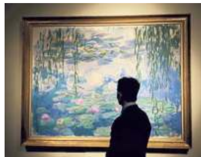
▲ Ducale Le Ninfee di Monet