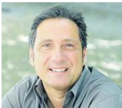
▲ Il geologo Mario Tozzi ospite del Festival delle Parole a Chiavari