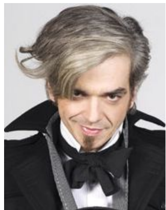
MORGAN Ospite di giovedì 4 maggio

La centralissima via Martiri della Liberazione (Caruggio Dritto) si trasformerà per quat-